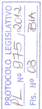
Deputada ELIANA PEDROSA