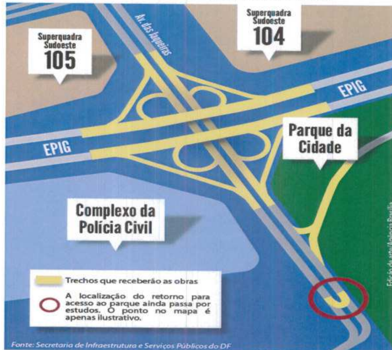
Viaduto da EPIG com o Sudoeste/Parque da Cidade - Trecho 2

serão feitos em trincheiras, ou seja, de forma subterrânea, de modo que os veículos que trafegam pela EPIG permanecem no nível atual da via. Com a mudança, quem sair do Parque da Cidade em direção ao Sudoeste não terá mais que passar por semáforos e retornos. Seguirá direto para a Avenida das Jaqueiras, passando embaixo da EPIG. No sentido inverso, haverá apenas um retorno para acessar a pista do parque. A obra também permitirá sair do Sudoeste no mesmo nível da avenida das Jaqueiras e seguir para a EPIG, sentido Plano Piloto e vice-versa, sem a necessidade de retorno.