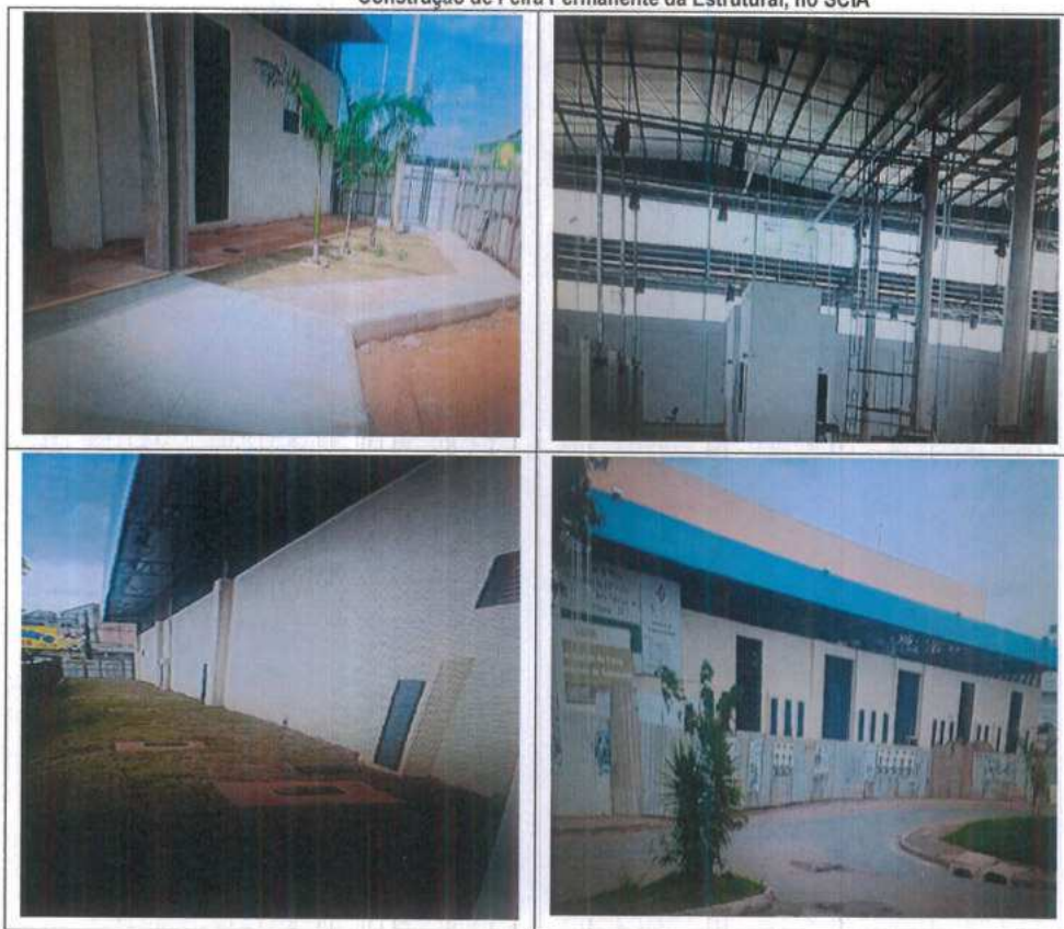
Construção de Feira Permanente da Estrutural, no SCIA

concluído se tratar de endereçamento que contempla trecho fora do Distrito Federal. A constatação da Terracap tornou necessária, então, a celebração prévia de Acordo de Cooperação entre o DF, a Novacap e o Município de Santo Antônio do Descoberto/GO para a consecução de objetos comuns. Quanto aos recursos descentralizados à Novacap estes foram utilizados integralmente na finalidade estabelecida no ato de transferência.