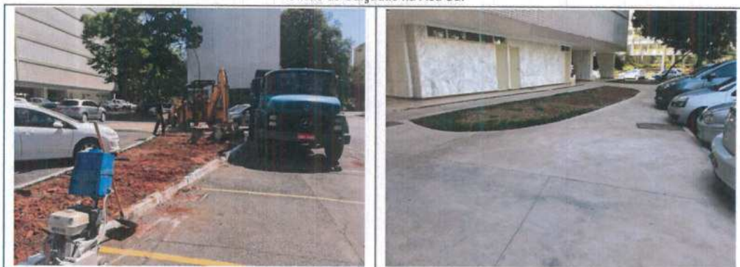
Quadra SQS - 107

Handwritten signatures and initials in blue ink.