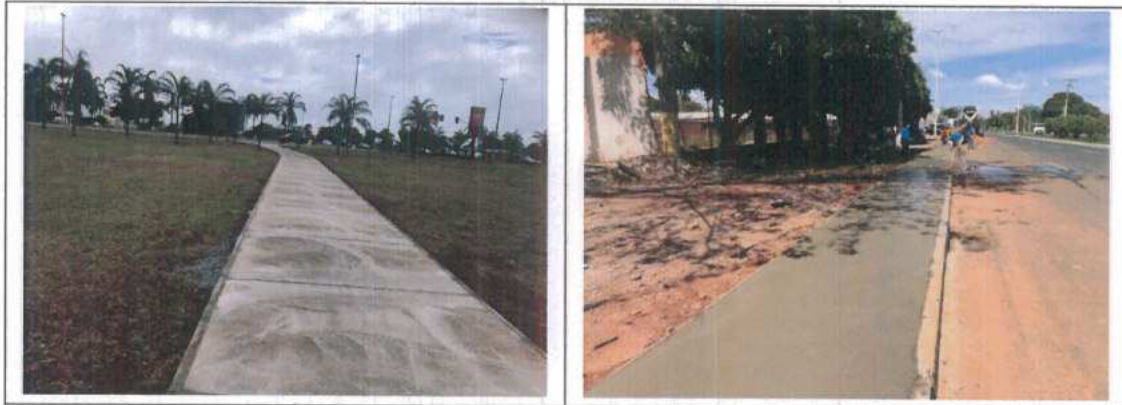
Construção da Pista de Cooper na Vila Planalto, no Plano Piloto.