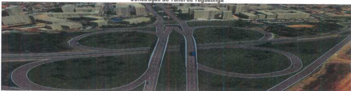
Construção do Túnel de Taguatinga

O túnel fará uma ligação subterrânea para quem segue para Ceilândia, pela via Elmo Serejo, além de oferecer uma via alternativa pela superfície para o Centro de Taguatinga. Isso evitará a retenção de veículos nos semáforos do centro de Taguatinga. Com a conclusão da obra, os carros que estiverem na Avenida Elmo Serejo, sentido Plano Piloto, mergulharão pelo túnel e sairão na Estrada Parque Taguatinga (EPTG). Do outro lado, aqueles que chegarem à Taguatinga pela EPTG também passarão por ele até o início da Via Estádio, saindo logo após o viaduto da Avenida Samdu. Vias marginais darão acesso às Avenidas Comerciais e Samdu Sul e Norte. O túnel terá 830 metros de extensão e vai contar com duas pistas paralelas, cada uma com três faixas de rolagem em cada sentido. Com investimento inicial previsto em R$200 milhões, o túnel beneficiará a trafegabilidade para os 135 mil carros que circulam diariamente pela região.