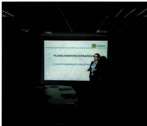
Apresentação da metodologia BSC utilizada pela Semob em seu Planejamento Estratégico Institucional