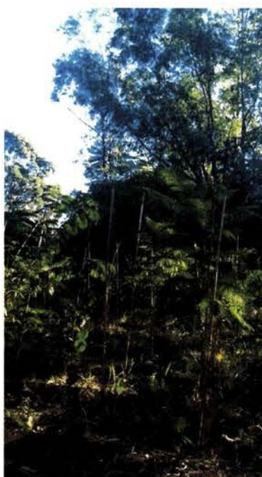
Áreas complementares, após roçada semi-mecanizada, com muda de Piptadenia gonoacantha (Pau jacaré) se destacando em crescimento em altura. 11-mai-2017.

Adicionalmente, visando ao Fortalecimento Institucional da SEMOB, estão em curso os processos para aquisição de soluções de software e treinamentos, com a finalidade de dotar a Secretaria e órgãos vinculados de recursos tecnológicos para a elaboração de projetos, planejamento de tráfego e de sistemas de transportes (macrossimulações e microssimulações), geoprocessamento (GIS – Sistema de Informações Geográficas) e automatização de projetos viários em ferramenta CAD (Projeto Assistido por Computador).