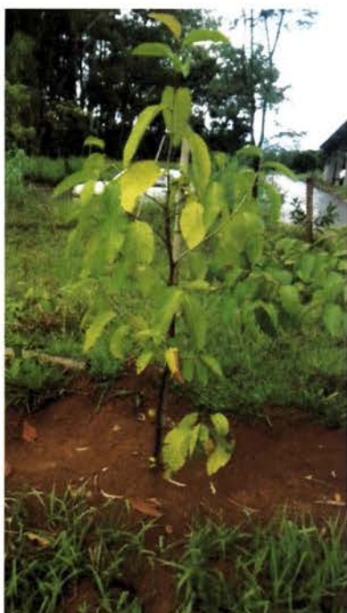
Áreas complementares, muda de Triplaris americana (Pau-formiga) com 1 ano de idade. 21-mar-2017.