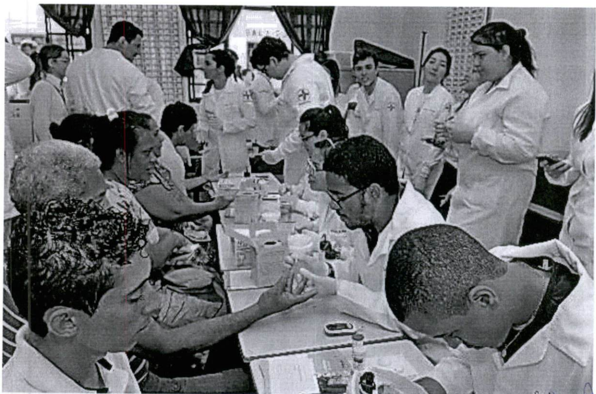
Mutirão de Cidadania – Cidade Estrutural/DF – Exames de medição de glicose

Handwritten signature in blue ink, possibly reading 'C. J. J. J. J.' or similar.