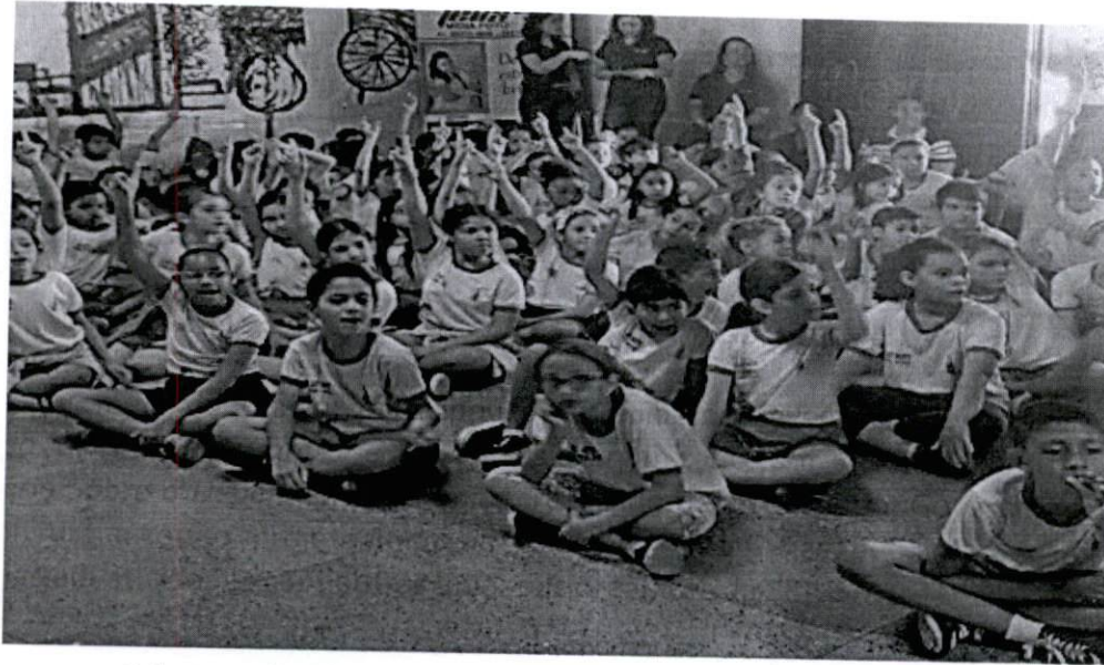
Palestras sobre drogas para crianças da rede pública de ensino do DF

drogas por meio do teatro; participou do seminário Prevenção Educacional ao Uso Indevido de Drogas, Crimes e Violências - organizado por mestres da UNB, e do Seminário Sobre a Dependência Química , realizado pela Escola de Governo do Distrito Federal; organizou o projeto Roda de Crianças em escolas públicas e estabeleceu parcerias em atividades com outras unidades orgânicas da SEJUS.