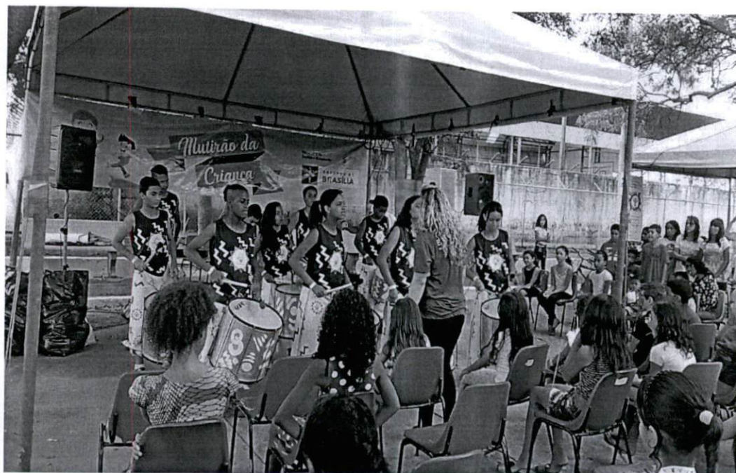
Mutirão da Criança na Ceilândia – Apresentação de grupo musical

A distribuição de material informativo e as atividades desenvolvidas com as crianças ao longo do exercício tiveram enfoque na prevenção de doenças, do uso e abuso de drogas e na prevenção a todas as formas de violência, que também incluíram o combate ao tráfico de pessoas. Os dois Mutirões da Criança totalizaram uma média de 3 mil atendimentos, entre atividades no local e distribuição de material informativo.