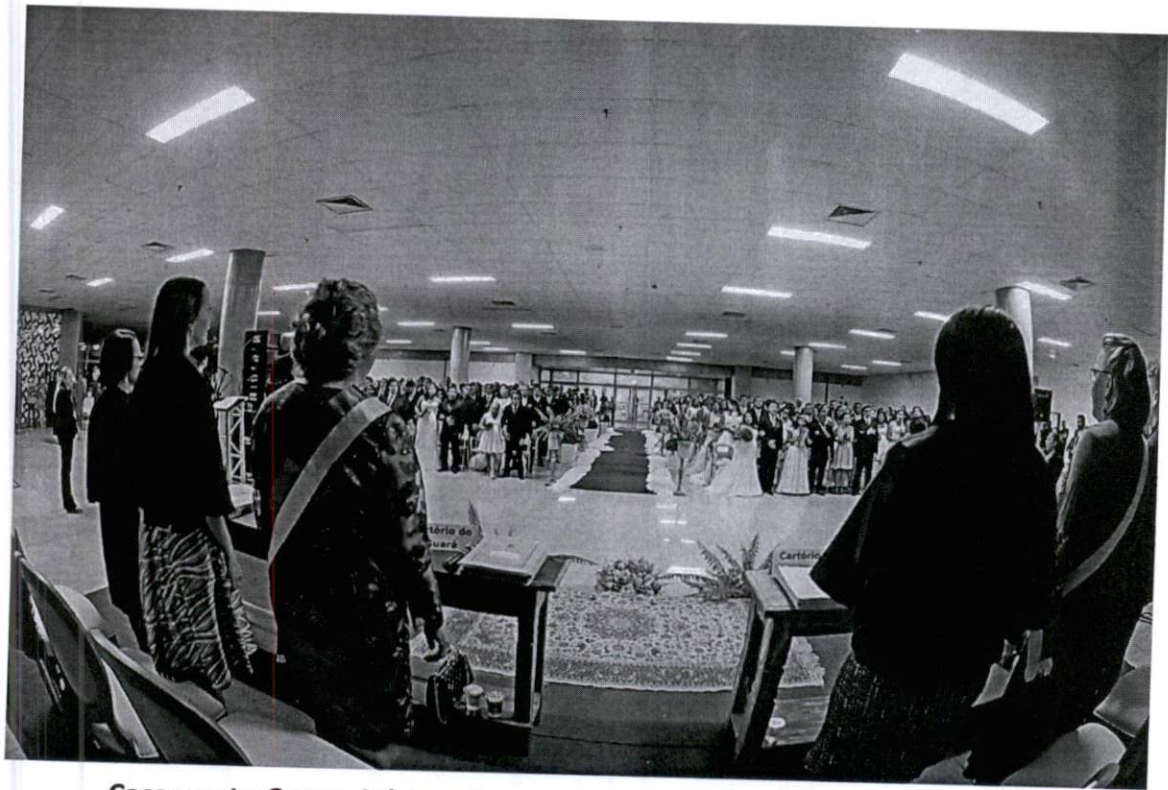
Casamento Comunitário – Centro de Convenções Ulisses Guimarães

Handwritten signature in blue ink, possibly reading "J. M. de Jesus".