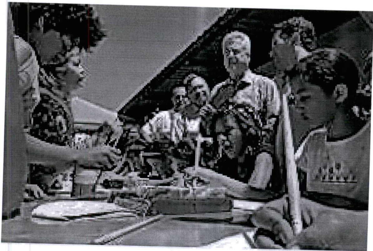
Mutirão da Criança no Paranoá/DF – Oficina de arte