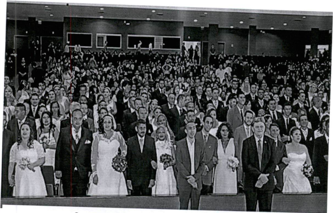
Casamento Comunitário – Estádio Mané Garrincha