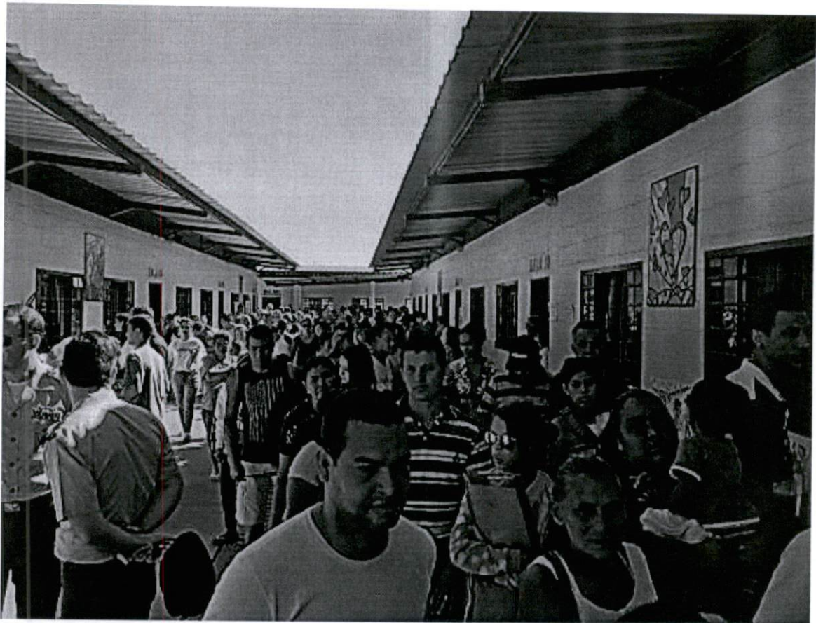
Mutirão de Cidadania em Arapoanga/Planaltina