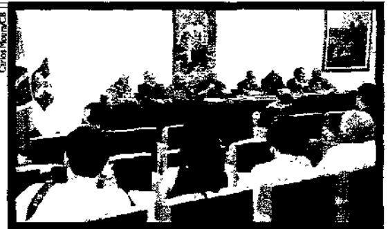
DEBATEDORES NÃO CHEGARAM A CONSENSO SOBRE INÍCIO DAS OBRAS DA CAPITAL