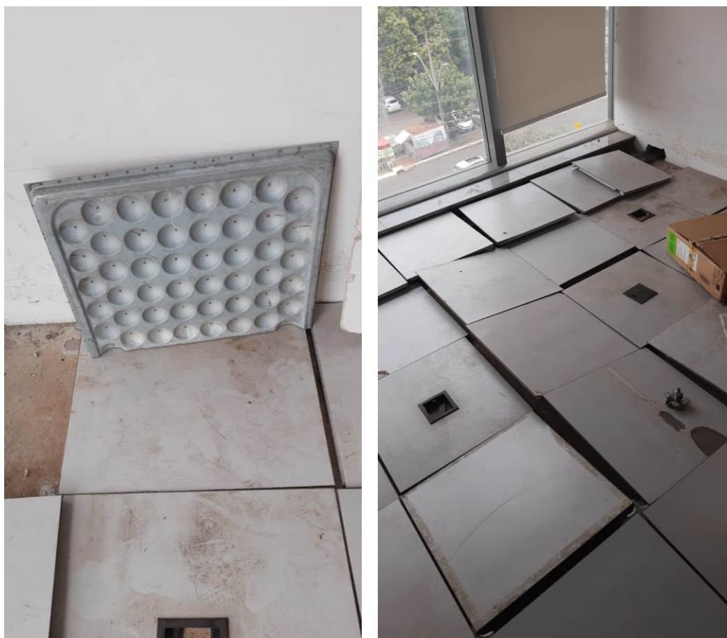
Piso elevado existente