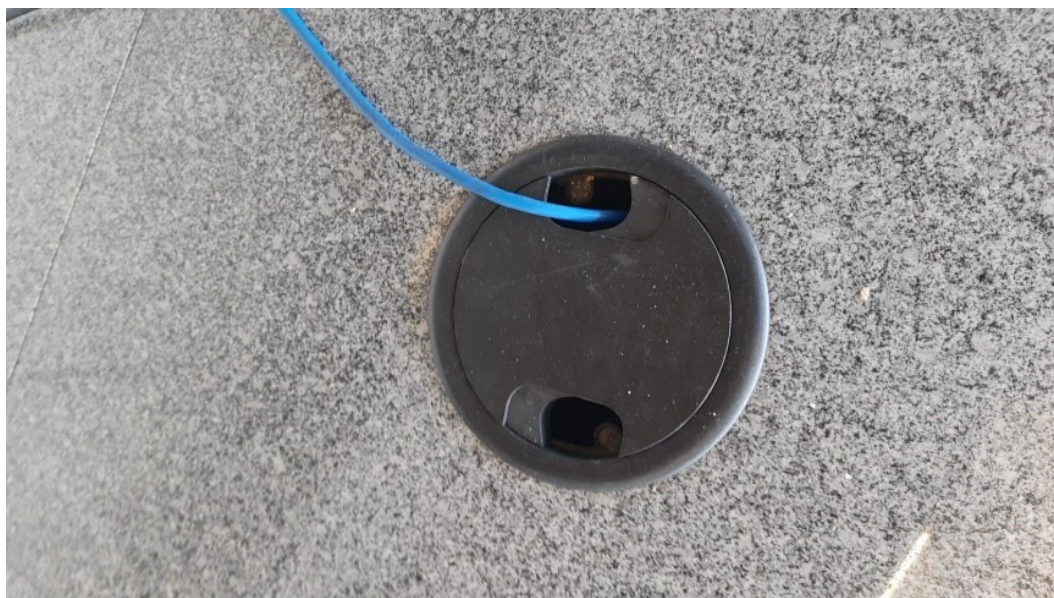
Arremate circular para passagem de cabo