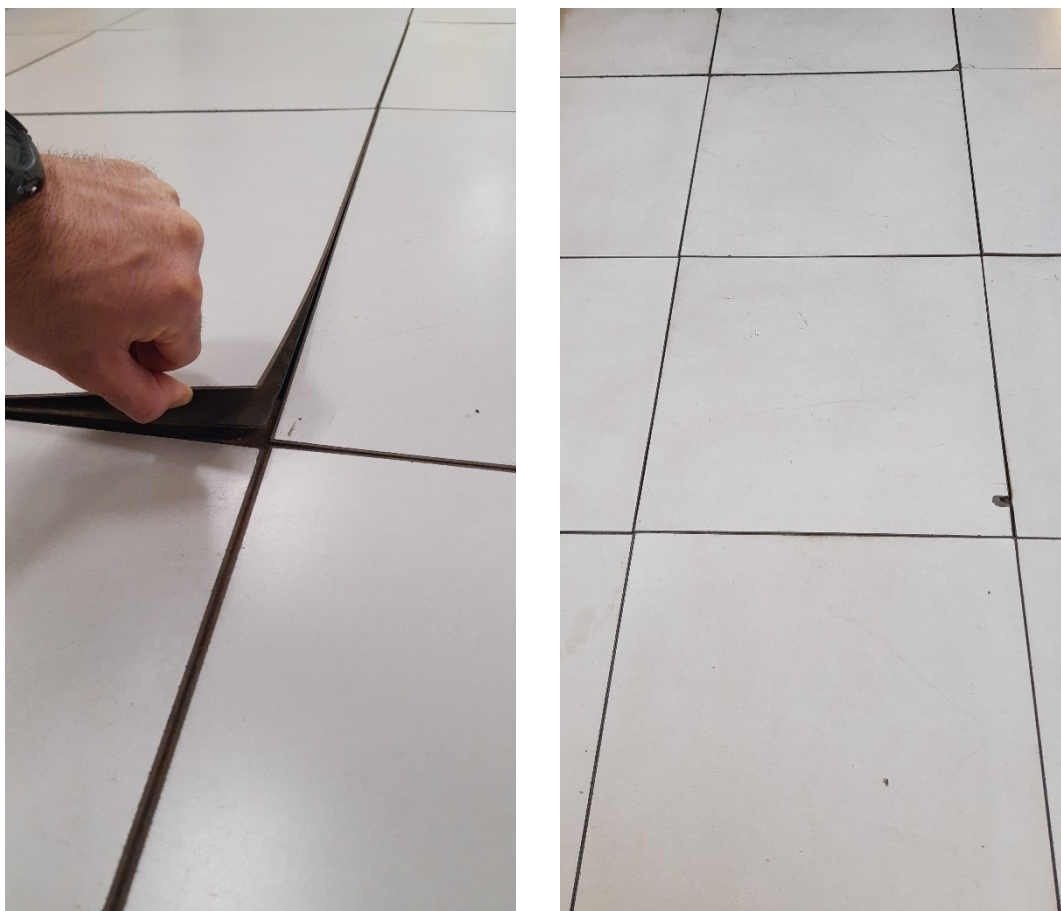
Situação atual do piso

O serviço a ser contratado também traz benefícios estéticos, pois o revestimento do piso, no geral, encontra-se desgastado e encardido, e a instalação de novas placas, além de resolver questões laborais, irá padronizar o ambiente da CMI com o restante da Casa.