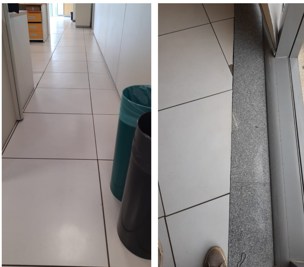
Piso elevado existente