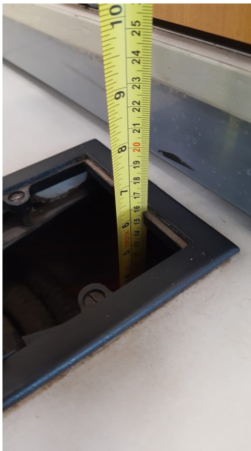
Altura de 16 cm