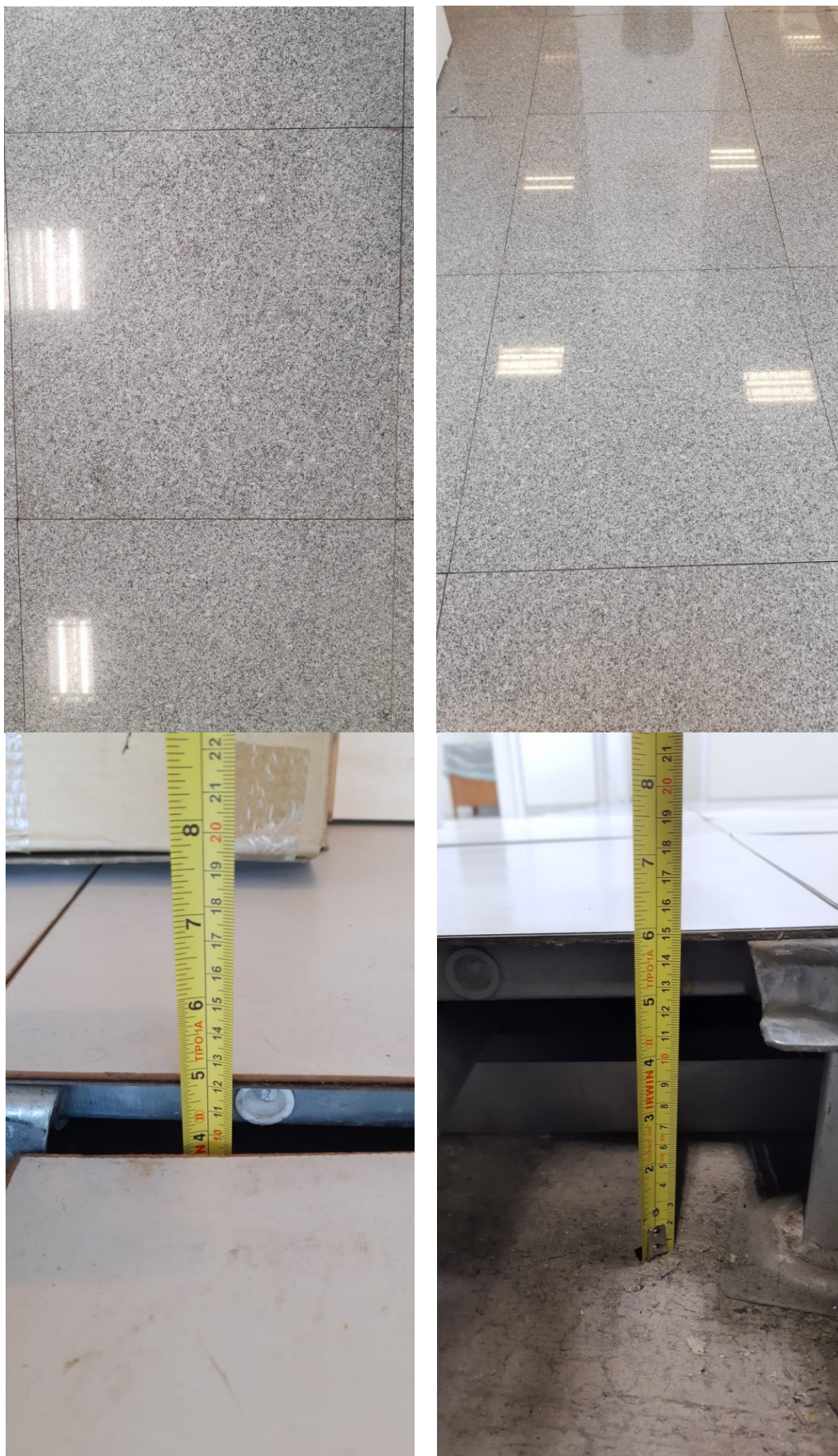
Alturas com 12 e 15 centímetros (esquerda, direita)