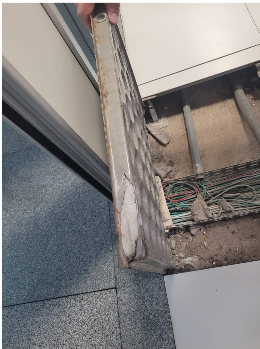
Situação atual do piso