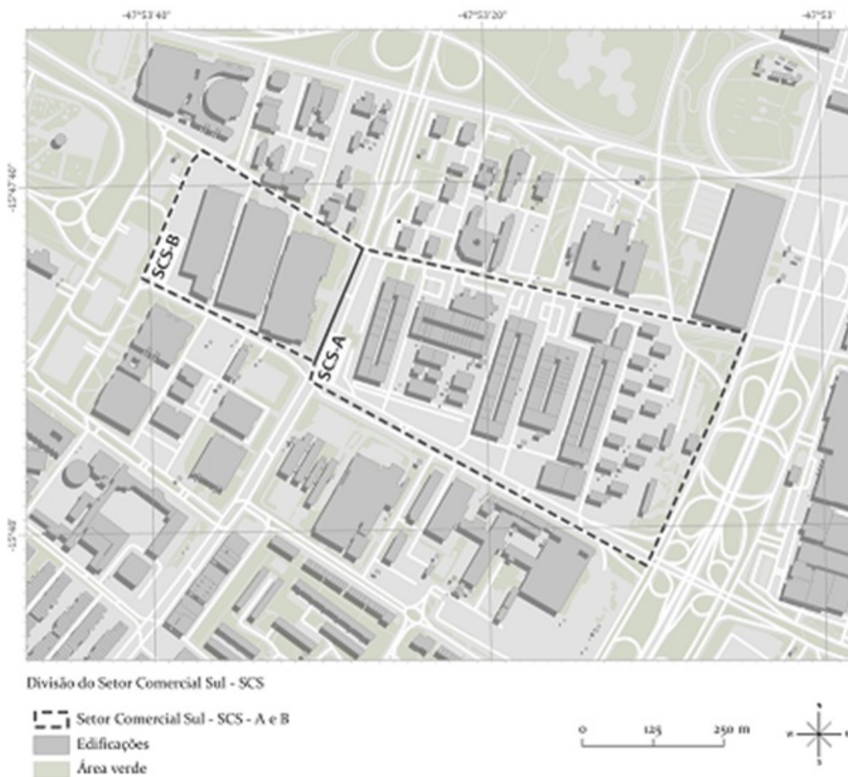
Figura 1: Localização do SCS.