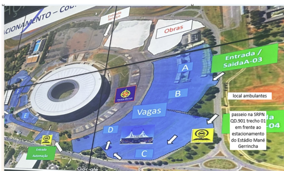
ÁREA 01 – 20 vagas barraca na SRPN QD.901 trecho 01 – Asa Norte.