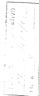
Deputado DANIEL MARQUES-PMDB

Sala das Sessões, em de novembro de 2001.