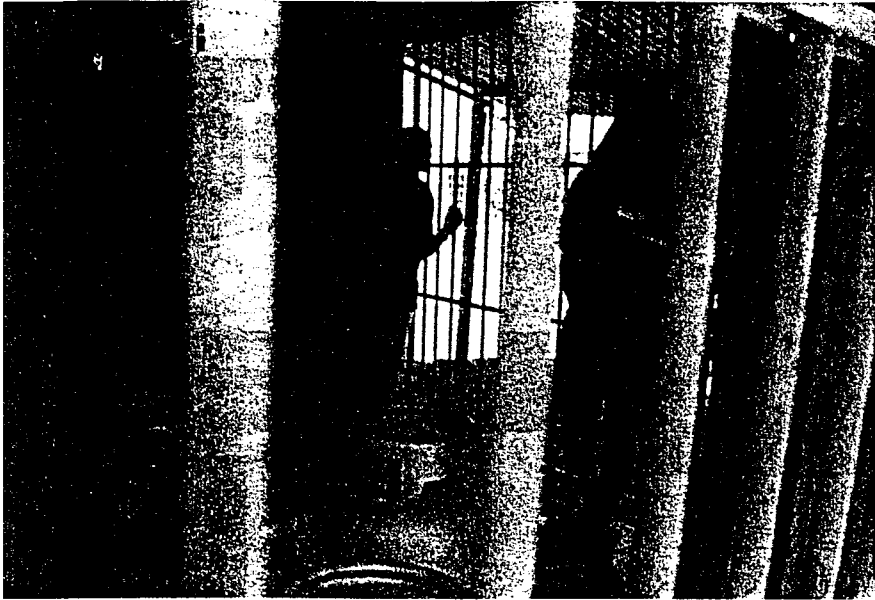
Estada, dona do mercado onde Marroni foi morto diz que agora só atende por trás das grades