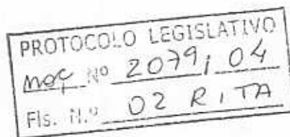
Deputado GIM ARGELLO