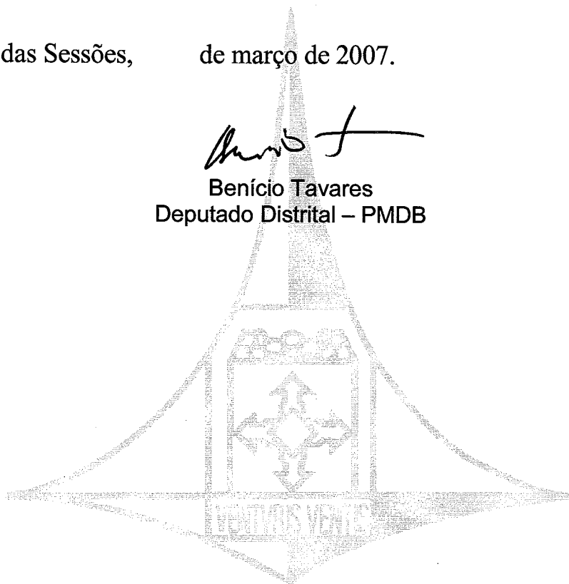
Benício Tavares Deputado Distrital – PMDB