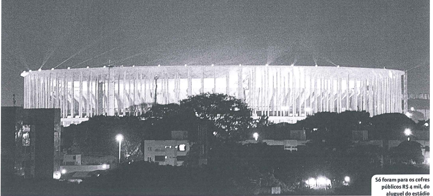
Só foram para os cofres públicos R$ 4 mil, do aluguel do estádio

Ninguém explica por que a Aoxy ficou com os R$ 6,9 milhões da bilheteria de Santos e Flamengo