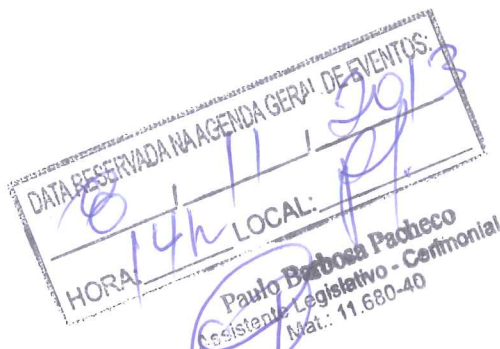
Prof. Israel Batista Deputado Distrital - PV