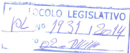
DEPUTADO WASNY DE ROURE – PT/DF