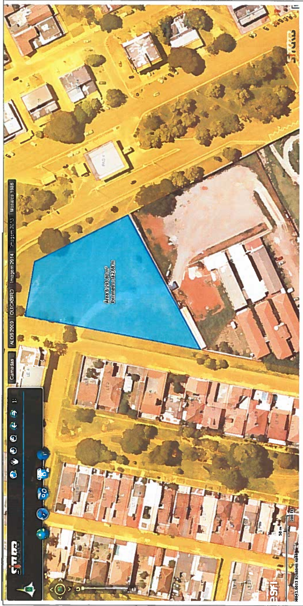
Fig. 2. Levantamento da área do imóvel a partir de dados do SITURB.