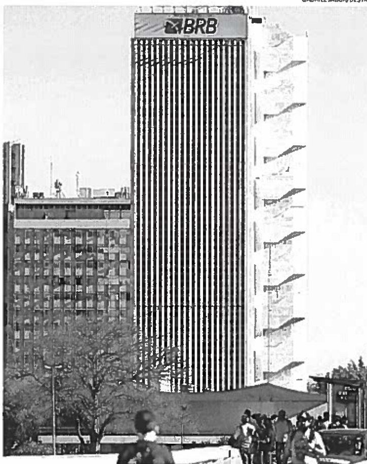
Contrato do banco com a Consist foi renovado este ano e vale até 2016

Assessoria da instituição disse que não teria tempo de responder a todos os questionamentos