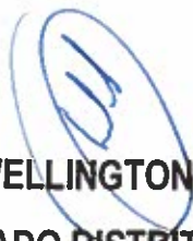
WELLINGTON LUIZ DEPUTADO DISTRITAL - PMDB