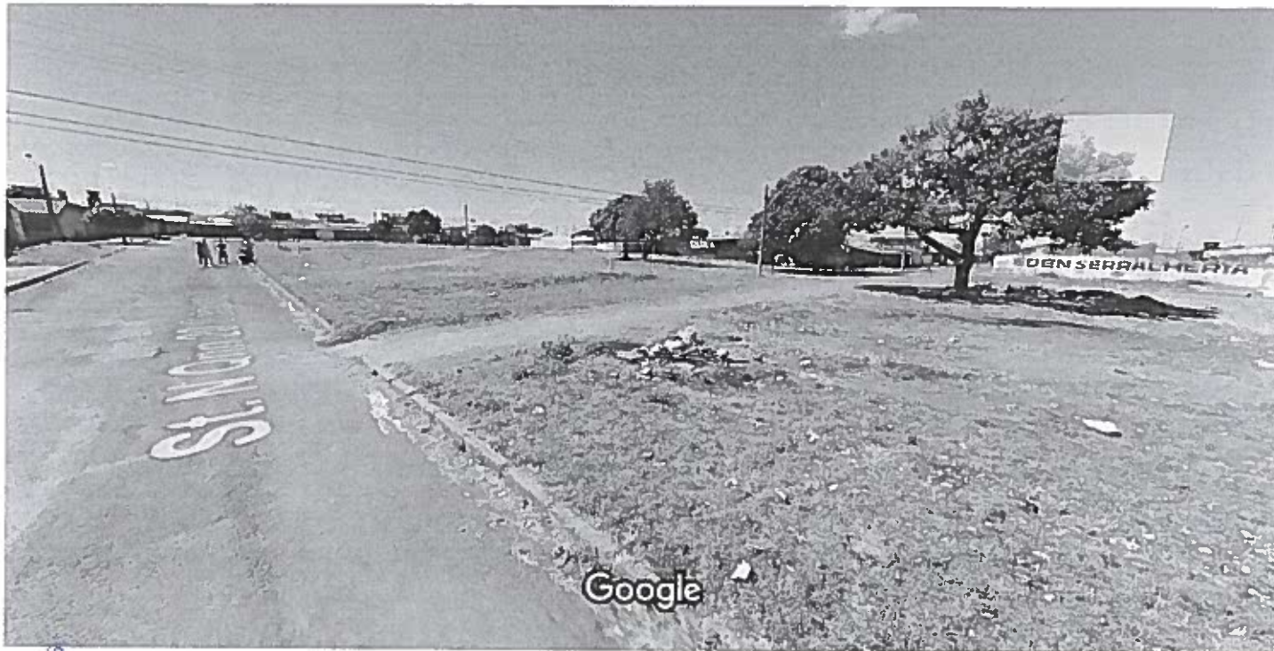
Captura da imagem: jul 2012