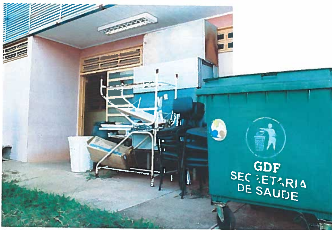
Figura 2 - Entulhos acumulados na parte de trás do prédio

PROTOCOLO LEGISLATIVO IMD Nº 7367 / 2016 Fls. Nº 02