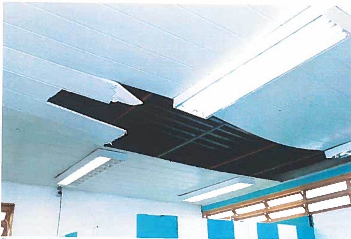
Figura 1 - Teto do Posto de Saúde do Areal