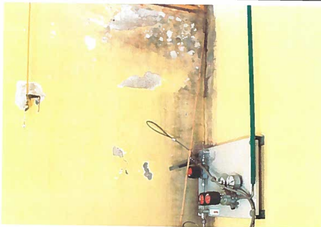
Figura 3 - Parte elétrica comprometida