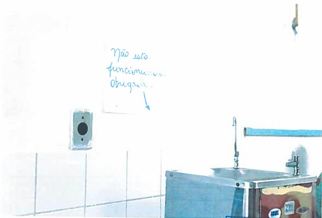
Figura 4 - Falta de água na unidade

PROTÓCOLO LEGISLATIVO IMD Nº 7367 / 2016 Fls. Nº 03