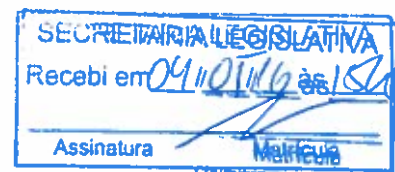
Ricardo Vale – PT Deputado Distrital