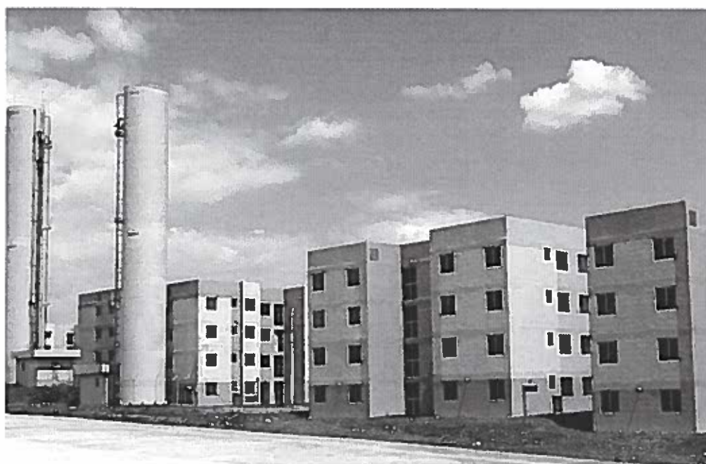
Construção erguida no Paranoá para atender beneficiários do programa Morar Bem