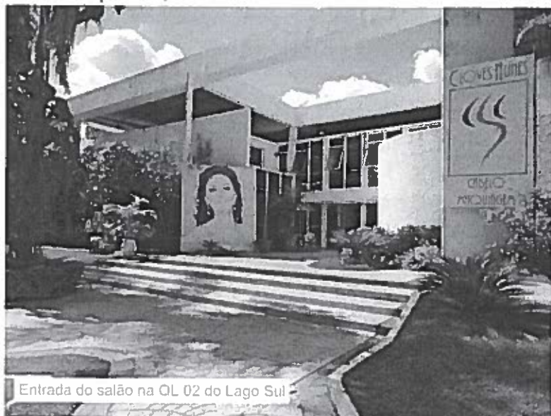
Entrada do salão na QL 02 do Lago Sul