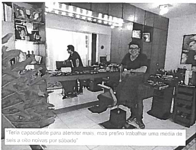
"Teria capacidade para atender mais, mas prefiro trabalhar uma média de seis a oito noivas por sábado"