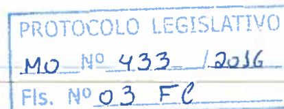
Deputado Cláudio Abrantes Rede Sustentabilidade – REDE /DF