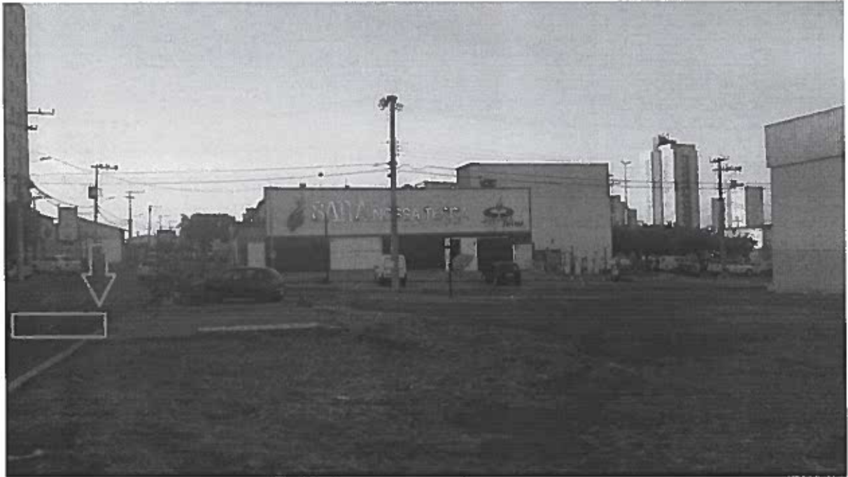
Localização: QS 106/108 Conjunto 1 – Samambaia – DF

PROTOCOLO LEGISLATIVO IND Nº 8318 / 2016 Fls. Nº 03 E.J.