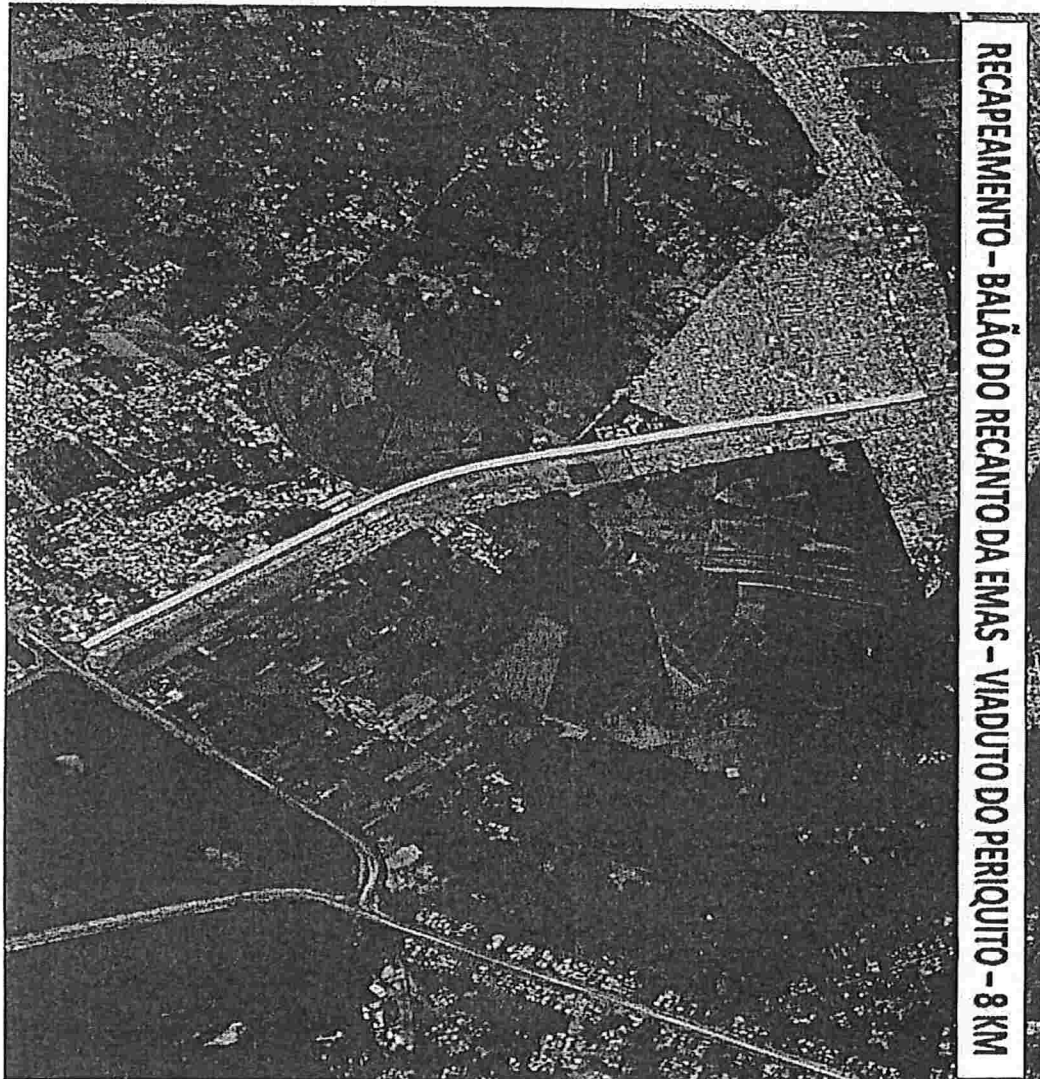
RECAPEAMENTO - BALÃO DO RECANTO DA EMAS - VIADUTO DO PERIQUITO - 8 KM

Sector Protocolo Legislativo JMB Nº 1660 / 2019 Folha Nº 02 MC