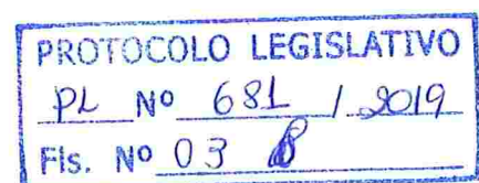
DEPUTADO DANIEL DONIZET PSDB/DF