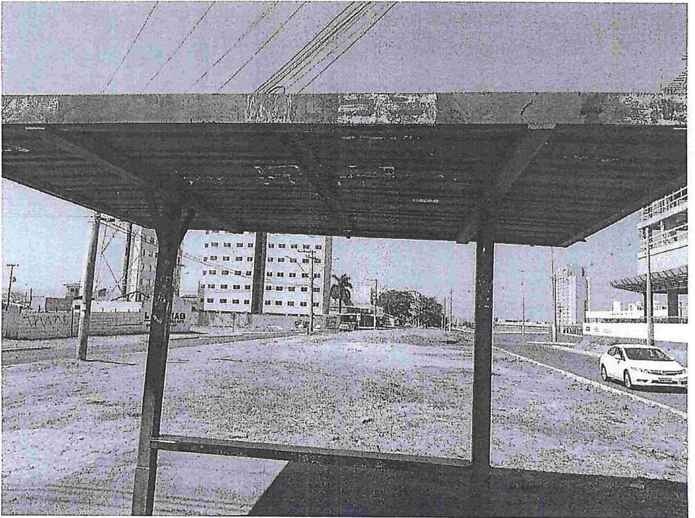
Ponto em metal, localizado no lado das quadras 300, ao lado direito do mesmo fora retirando o ponto de concreto novo para a construção da via.