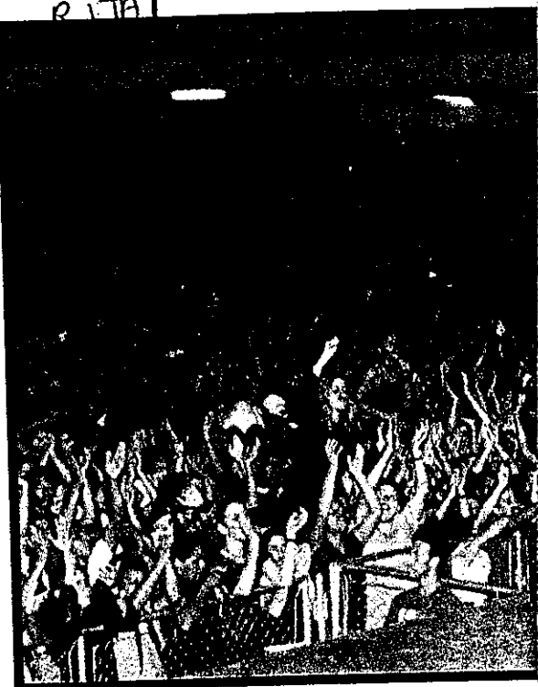
SHOW DA BANDA CHEIRO DE AMOR NO NILSON NELSON, EM OU