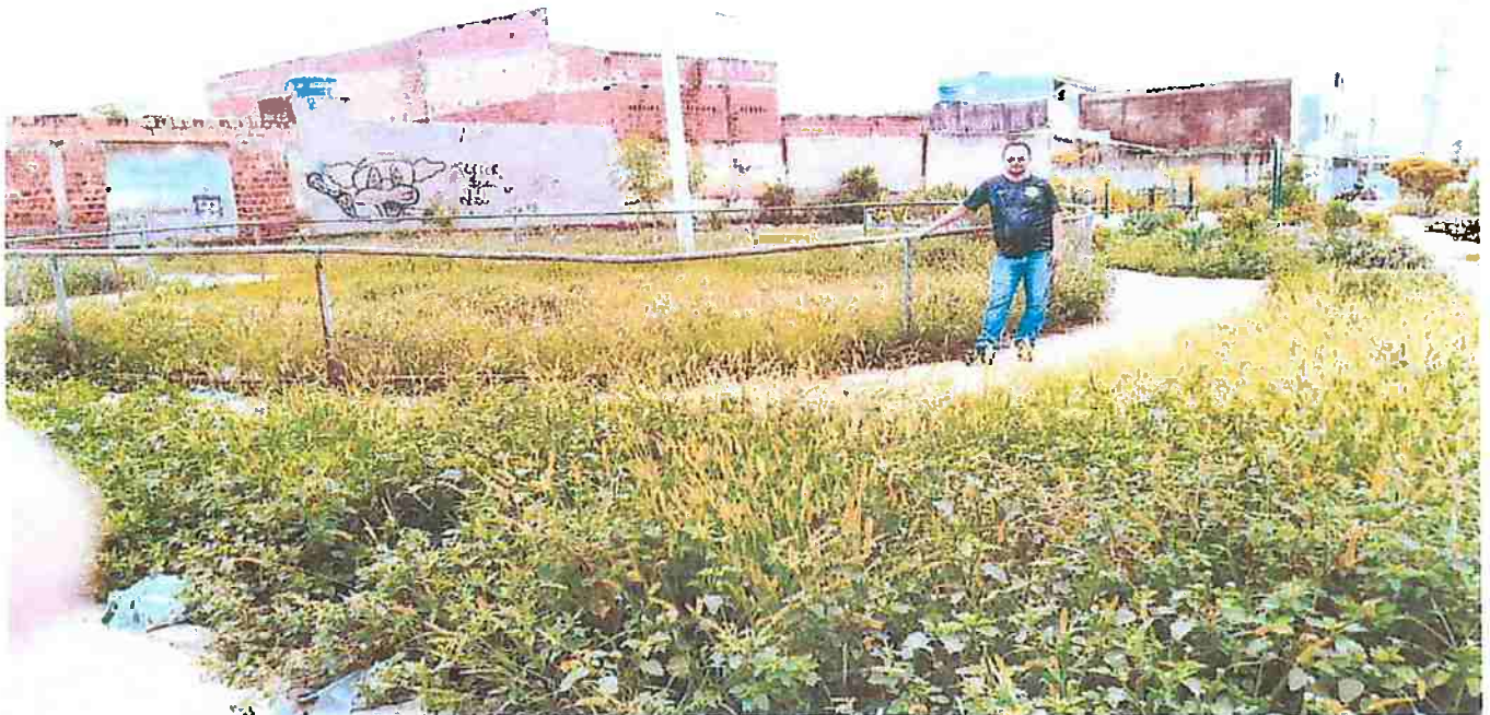
Foto do local para a Construção do Novo Parquinho Infantil

PREFEITURA COMUNITÁRIA DO SETOR P.SUL End.: EQNP 26/30 área Especial CNPJ: 01.717.180/0001-90