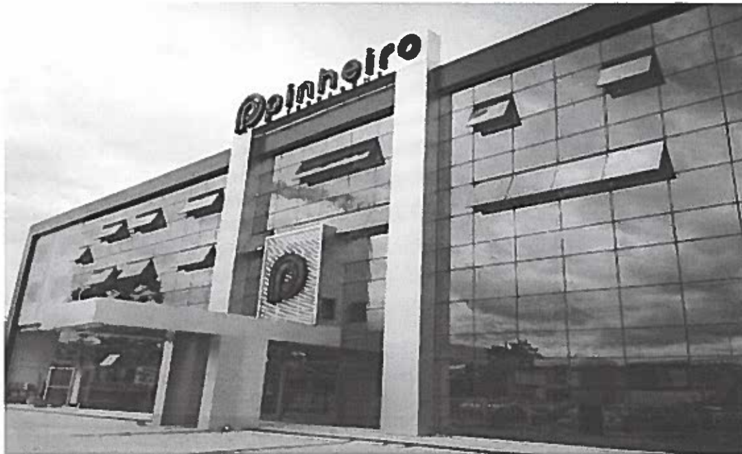
Ferragens Pinheiro SIA

Empresa com 55 anos de existência, dedicados ao fornecimento de ferragens em geral, especialmente tubos, telas, alambrados, aço para construção, arames e acessórios em geral. Trabalha com as melhores usinas do país, tais como Gerdau, Arcelor Mittal, Aço Cearense, Ferronorte, Usiminas, além de Eternit, Makita, Esab e outras consagradas marcas do mercado. A empresa conta com uma loja no Setor de Indústrias de Taguatinga e outra a ser inaugurada, em breve, no Setor de Indústria e Abastecimento de Brasília.