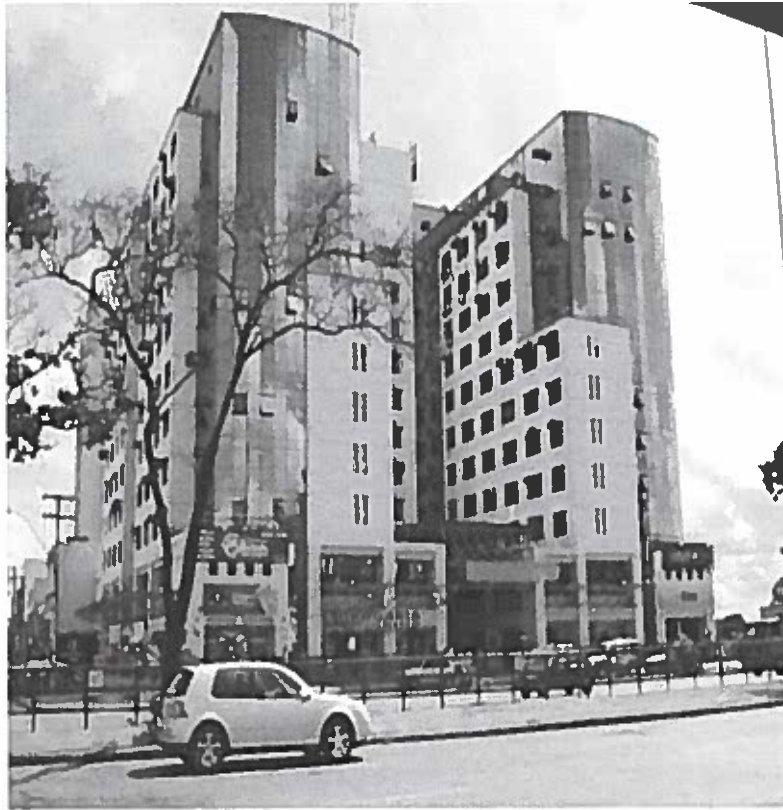
Taguatinga Trade Center