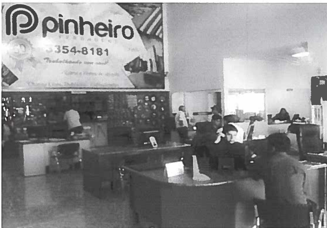
Ferragens Pinheiro Taguatinga