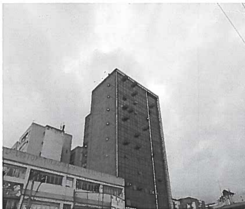
Centro Emp. Pinheiro de Brito

Setor de Protocolo Legislativo PDL Nº 58 / 2015 Folha Nº 05 FB