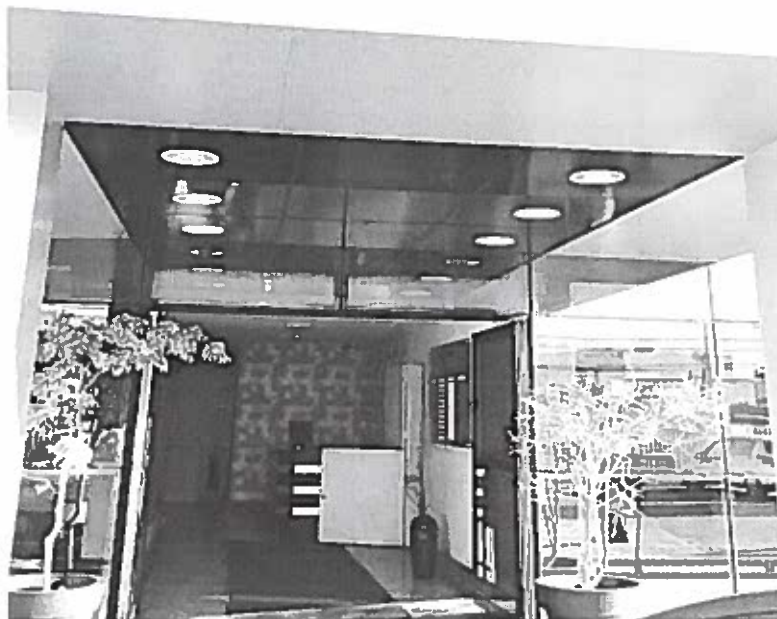
Edifício Pinheiro SIA