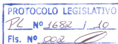
JAQUELINE RORIZ Deputada Distrital