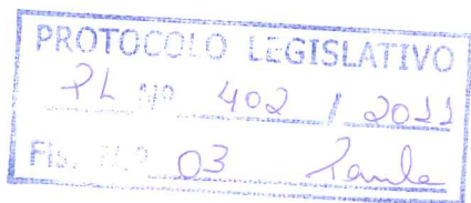
RAAD MASSOUH Deputado Distrital