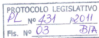
Deputada ELIANA PEDROSA