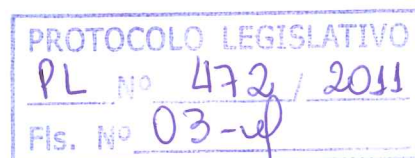
Deputado AGACIEL MAIA