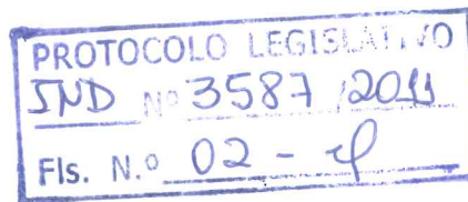
RAAD MASSOUH Deputado Distrital