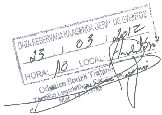
Prof. Israel Batista Deputado Distrital - PDT