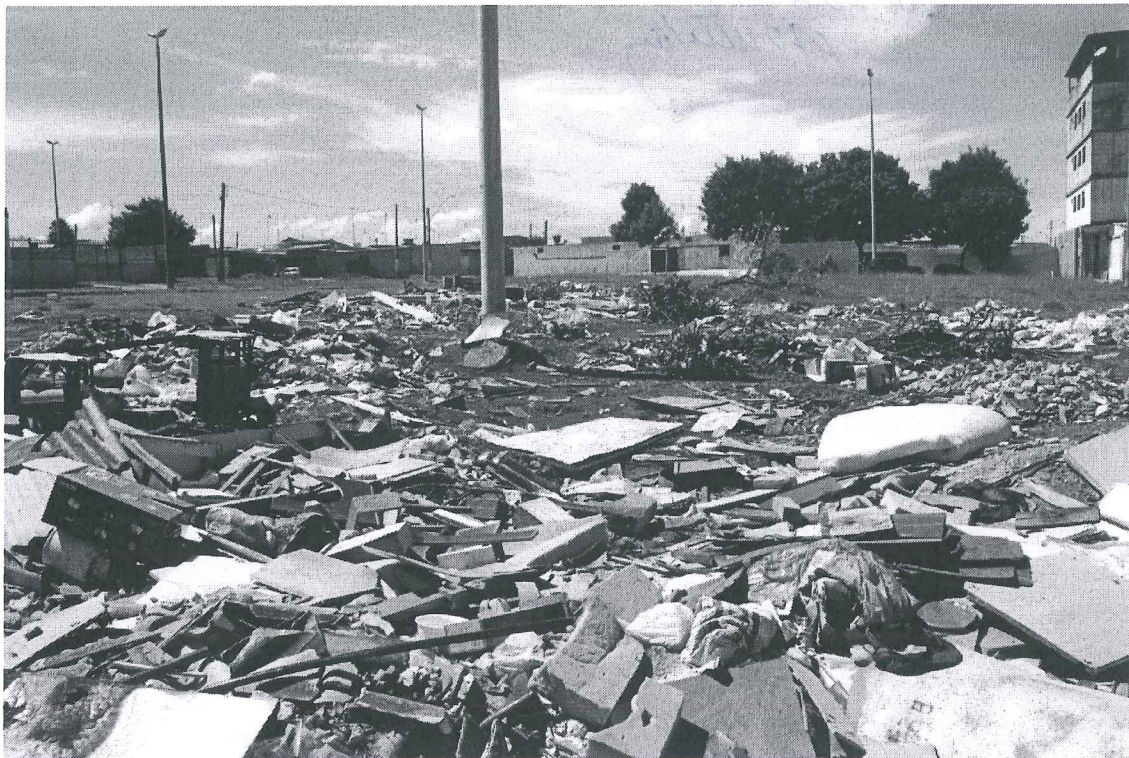
EQNN 3/5 – Ceilândia-DF

PROTOCOLO LEGISLATIVO IND Nº 4777/2012 Fls. Nº 02 Bete