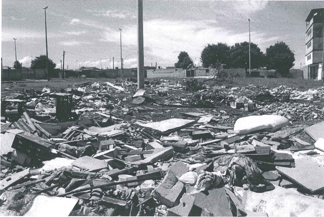
EQNN 3/5 – Ceilândia-DF

PROTOCOLO LEGISLATIVO IND Nº 4778 / 2012 Fis. Nº 02 B16