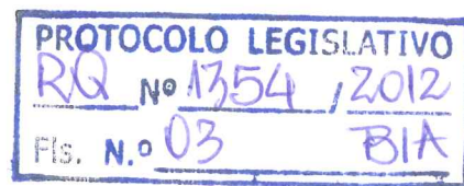
Deputado Prof. Israel Batista PDT/DF

Diante de todo o exposto, e do relevante interesse público de que se reveste a questão, solicito o encaminhamento urgente destas informações ao Sr. Secretário de Estado de Educação do Distrito Federal.