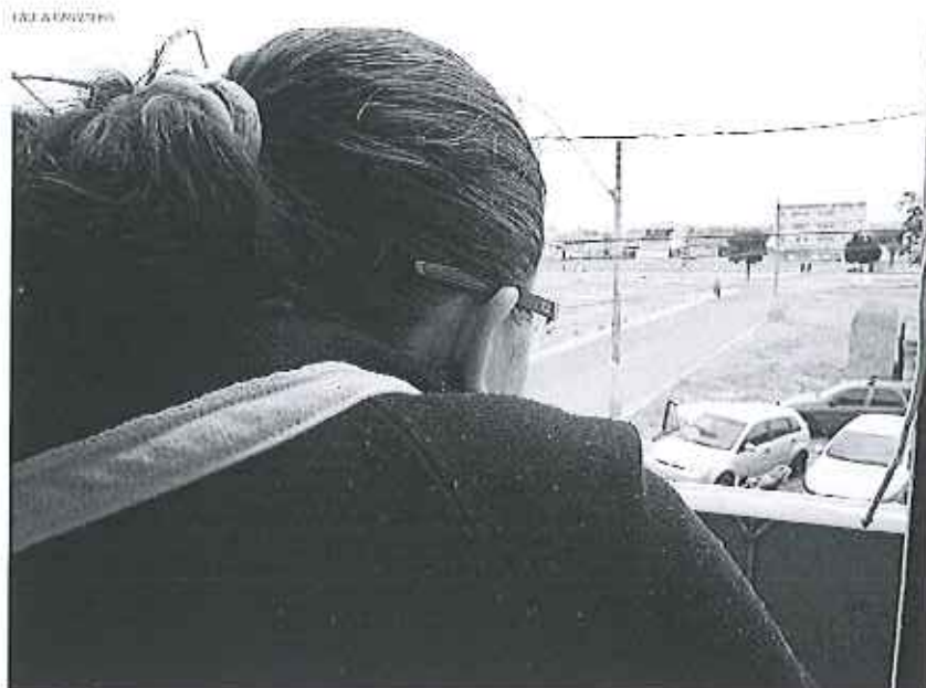
A autonomia T.A.S. foi abusada pelo técnico que fazia reparos na televisão de casa: "Entreli em pânico"

Na quinta-feira passada, um funcionário de uma empresa de telecomunicações foi detido suspeito de estuprar um adolescente que estava sozinho em casa, no Recanto das Emas. No mesmo dia, um pastor de 36 anos foi preso por abusar de quatro crianças em Águas Lindas (GO). Na última segunda, um homem foi preso por estuprar quatro mulheres. J.A.A., 41 anos, que afirmou ser o superintendente de Meio Ambiente da Prefeitura de Planaltina de Goiás, se passava por condutor de