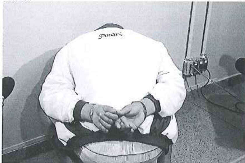
Segundo o relato das duas crianças, o homem praticou os abusos diversas vezes. Mãe flagrou o crime.