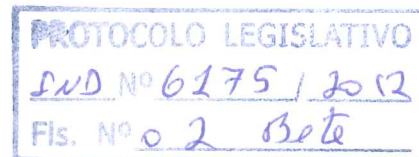
Deputado PROF. ISRAEL BATISTA PDT/DF