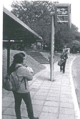
Modelo Estado do Rio de Janeiro

A presente proposição tem por finalidade sugerir ao Poder Executivo do Distrito Federal atender às reivindicações de usuários do transporte público do Distrito Federal. Todos os dias, trabalhadores, estudantes e pais de família vivem uma verdadeira humilhação diária e rotineira. Em plena capital do País, a população vem suportando o descaso do transporte público do Distrito Federal.