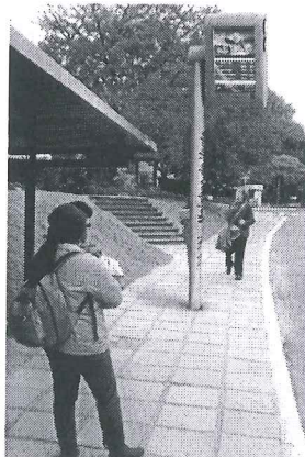
Modelo Estado do Rio de Janeiro

A presente proposição tem por finalidade sugerir ao Poder Executivo do Distrito Federal atender às reivindicações de usuários do transporte público do Distrito Federal. Todos os dias, trabalhadores, estudantes e pais de família vivem uma verdadeira humilhação diária e rotineira. Em plena capital do País, a população vem suportando o descaso do transporte público do Distrito Federal.