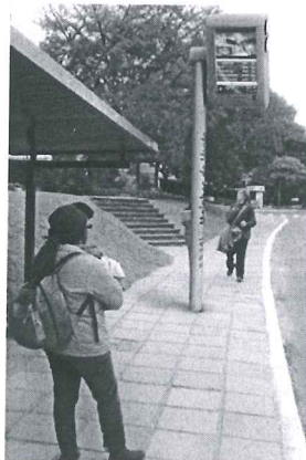
Modelo Estado do Rio de Janeiro

A presente proposição tem por finalidade sugerir ao Poder Executivo do Distrito Federal atender às reivindicações de usuários do transporte público do Distrito Federal. Todos os dias, trabalhadores, estudantes e pais de família vivem uma verdadeira humilhação diária e rotineira. Em plena capital do País, a população vem suportando o descaso do transporte público do Distrito Federal.