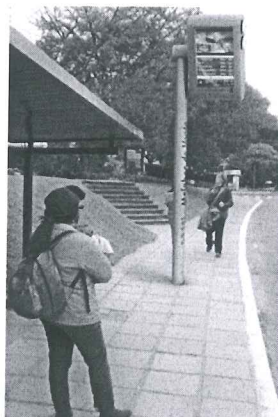
Modelo Estado do Rio de Janeiro

A presente proposição tem por finalidade sugerir ao Poder Executivo do Distrito Federal atender às reivindicações de usuários do transporte público do Distrito Federal. Todos os dias, trabalhadores, estudantes e pais de família vivem uma verdadeira humilhação diária e rotineira. Em plena capital do País, a população vem suportando o descaso do transporte público do Distrito Federal.