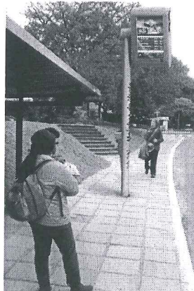
Modelo Estado do Rio de Janeiro

A presente proposição tem por finalidade sugerir ao Poder Executivo do Distrito Federal atender às reivindicações de usuários do transporte público do Distrito Federal. Todos os dias, trabalhadores, estudantes e pais de família vivem uma verdadeira humilhação diária e rotineira. Em plena capital do País, a população vem suportando o descaso do transporte público do Distrito Federal.