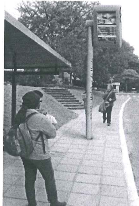
Modelo Estado do Rio de Janeiro

A presente proposição tem por finalidade sugerir ao Poder Executivo do Distrito Federal atender às reivindicações de usuários do transporte público do Distrito Federal. Todos os dias, trabalhadores, estudantes e pais de família vivem uma verdadeira humilhação diária e rotineira. Em plena capital do País, a população vem suportando o descaso do transporte público do Distrito Federal.