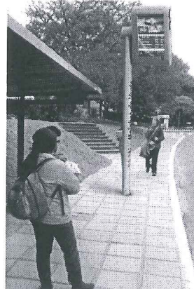
Modelo Estado do Rio de Janeiro

A presente proposição tem por finalidade sugerir ao Poder Executivo do Distrito Federal atender às reivindicações de usuários do transporte público do Distrito Federal. Todos os dias, trabalhadores, estudantes e pais de família vivem uma verdadeira humilhação diária e rotineira. Em plena capital do País, a população vem suportando o descaso do transporte público do Distrito Federal.