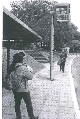
Modelo Estado do Rio de Janeiro

A presente proposição tem por finalidade sugerir ao Poder Executivo do Distrito Federal atender às reivindicações de usuários do transporte público do Distrito Federal. Todos os dias, trabalhadores, estudantes e pais de família vivem uma verdadeira humilhação diária e rotineira. Em plena capital do País, a população vem suportando o descaso do transporte público do Distrito Federal.